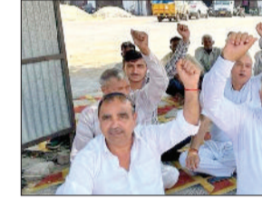
सरकार के खिलाफ नारेबाजी करते हुए आड़ती।

पुरानी मंडी में दो घंटे तक धरना देते हुए सरकार के खिलाफ नारेबाजी की हरिभूमि न्यूज ►► उचाना