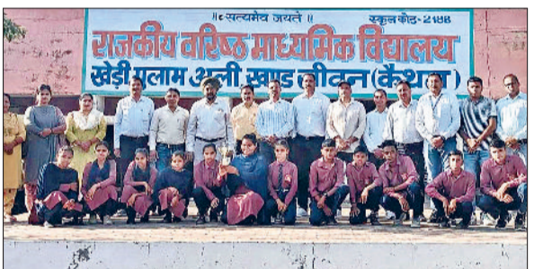
कैथल। अबल रहे खेडी गुलामअली स्कूल के विद्यार्थी।