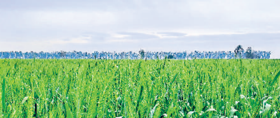
जींद। आसमान में छाए बादल।

मौसम के बिगड़े तैवरों के चलते जिले में बीती रात बूदाबांटी से किसानों ने करवटें बदल कर आंखों में कांटी। वीरवार को दिन में राहत मिली तो शाम को फिर से आकाश में छाए बादल फसलों पर खतरा बन कर मंडराने लगे। बादलों के आकाश में जमावड़े ने किसानों की चिंता को बढ़ा दिया। किसानों का लगातार भय सताता रहा कि कहीं मौसम के बदले तैवर उनकी तैयार फसलों को चौपट न कर दें। वीरवार को अधिकतम तापमान 34 डिग्री तथा