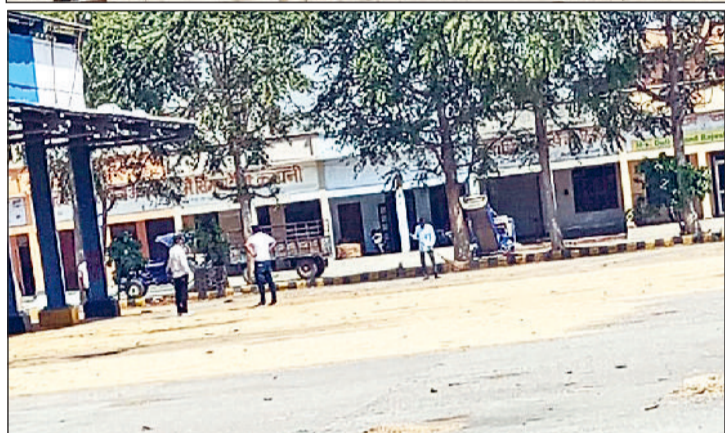
जीद। सफीदों अनाज मंडी में आढ़तियों के द्वारा फैलाया गेहूं।