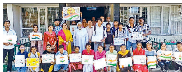
नरवाना। पोस्टर दिखाते विद्यार्थी।