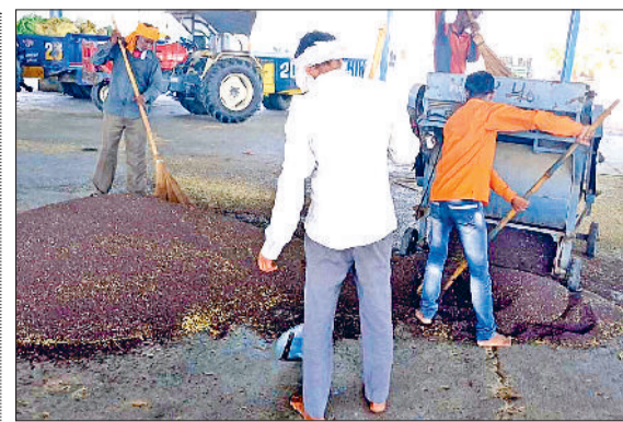
पुंडरी। मंडी में सरसों की ढेरी को साफ करते मजदूर।