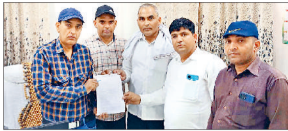
जींद। ज्ञापन सौंपते रोडवेज कर्मचारी।