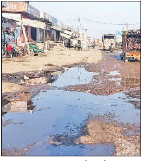
राजौंद। कन्या स्कूल की गली के सामने सड़क पर भारा गंदा पानी।

गली में जमा पानी के कारण छात्राएं परेशान राजौंद। राजकीय कन्या वरिष्ठ माध्यमिक विद्यालय के सामने सड़क व गली की दुर्दशा को लेकर छात्राओं को भारी परेशानी झेलनी पड़ रही है। आलम यह है कि इस गली से खाली निकलना भी कठिन हो गया है। जबकि यहां से सैकड़ों छात्राएं प्रतिदिन गुजरती हैं। क्योंकि सड़क पर पानी की निकासी नहीं है सारा पानी सड़क और गली में भर जाता है। असंघ रोड से कन्या स्कूल के मुख्य द्वार तक गली पूरी तरह उबड़ खाबड़ हो चुकी है और यह समस्या वर्षों से बनी हुई है। इस दौरान पैदल भी नहीं निकला जा सकता।