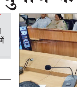
जींद। वीसी में भाग लेते हुए अधिकारी।

शराब की अवैध आवाजाही व नकली शराब की शिकायत किसी भी सूत्र में नहीं होगी बर्दाश्त : मीणा हरिभूमि न्यूज ►► जींद